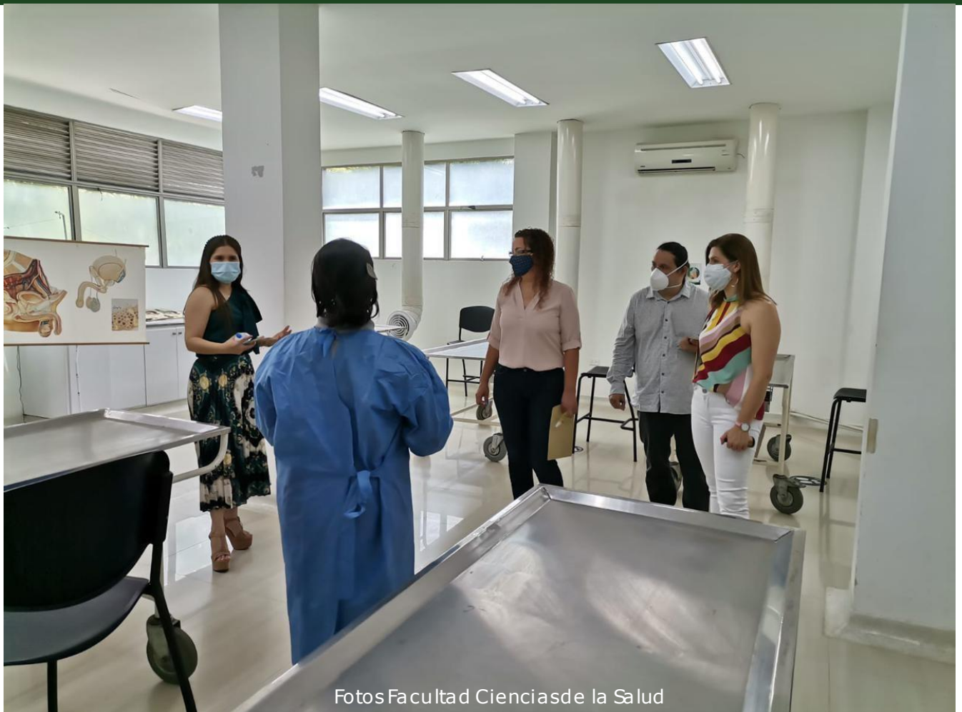
Fotos Facultad Ciencias de la Salud