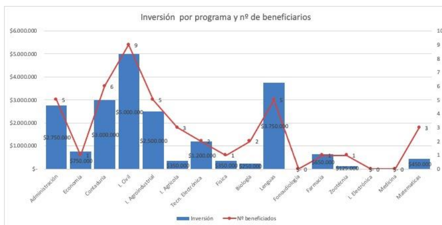
Figura No. 6

Se Indica que el valor total de inversión para el programa Plan Padrino subsidio matrícula es de veintiún millones ciento veinticinco mil pesos ( $21.125.000 ) distribuidos por programas académicos como se evidencia en la tabla.