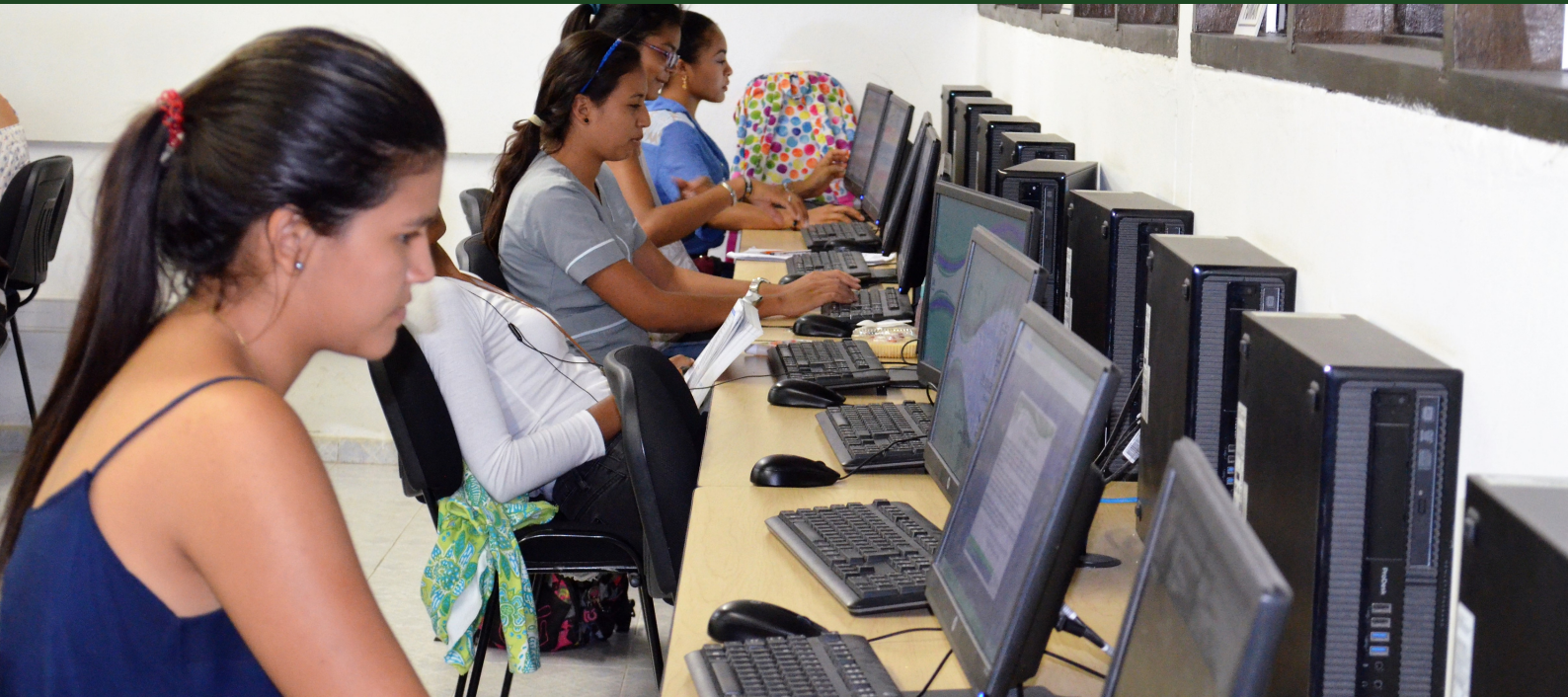
Sala de Computo - Campus Ciencias de la Salud