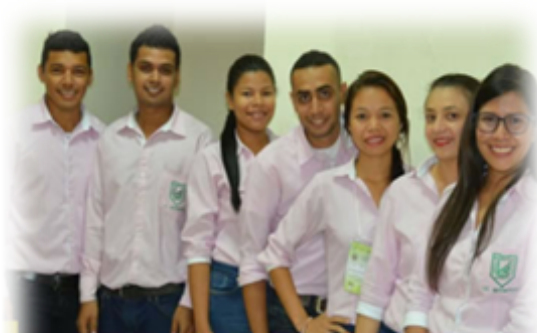
Licenciatura en Matemáticas