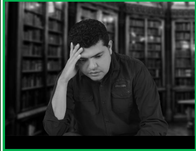
Fotografía: Jorge Luis del Río Vásquez

Jorge Luis del Río Vásquez, Cartagena, Bolívar, Colombia. Escritor y gestor cultural. Es egresado del programa de Dirección y Administración de Empresas con Énfasis en Mercadeo. Ha publicado los libros: Derrota otra vez del olvido (2004), Los Cuadernos del descreído (2011) y Voces extraviadas (2019). Sus trabajos han sido publicados en portales y revistas nacionales y extranjeros, ha sido distinguido con premios de poesía y narrativa. Presidente actual de la Unión de Escritores de Sucre. A continuación se presenta uno de sus escritos.