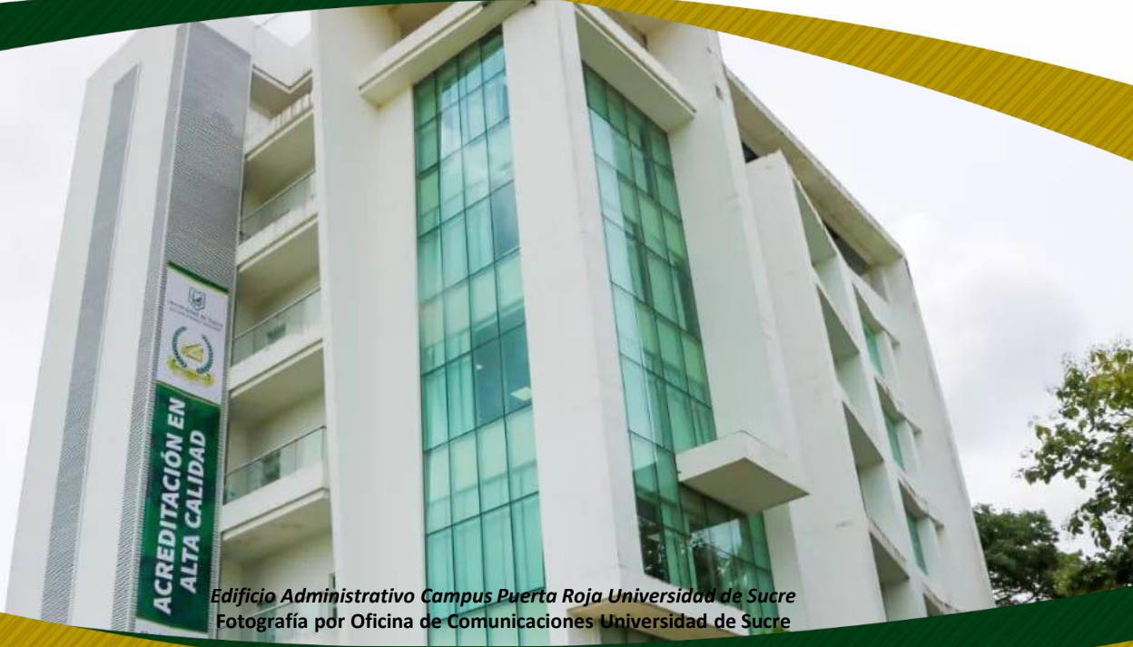
Edificio Administrativo Campus Puerta Roja Universidad de Sucre