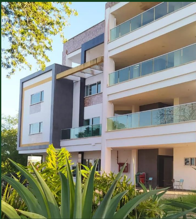
Bloque Multifuncional Primera Fase Campus Puerta Verde Universidad de Sucre

Este boletín tiene como objetivo informar sobre los aspectos más relevantes de la Planeación Institucional, para el cumplimiento de las funciones sustantivas de la Universidad de Sucre. En la misma línea, se presentará información concerniente a la gestión de proyectos, gestión ambiental, infraestructura, desarrollo institucional, Sistema de Gestión de Calidad, tecnología, entre otros, que son de gran importancia para la edificación de una mejor alma mater.