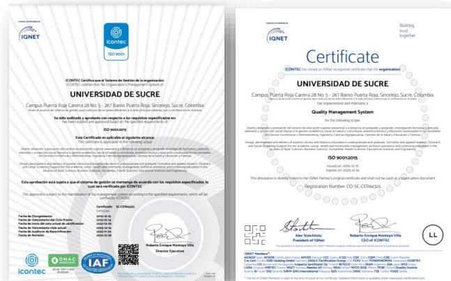
Certificados de Calidad otorgados por ICONTEC