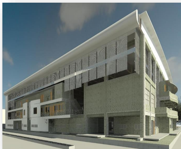
Diseño arquitectónico polideportivo Universidad de Sucre, fuente: Oficina de Planeación.