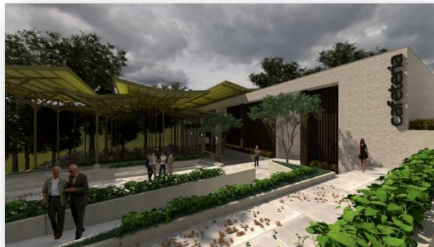
Diseño arquitectónico Restaurante Universitario.

Se dio inicio a la construcción del Restaurante Universitario de la Universidad de Sucre en el Campus Puerta Roja de la Institución, que tendrá la capacidad de atender simultáneamente a más de 300 integrantes de la comunidad universitaria. El proyecto contará con espacios para los alumnos y una zona para el personal administrativo y docente. Así como también áreas para la preparación de comidas, cocción, despensa, cuarto de refrigeración además de baterías de baños y zonas duras y de acceso peatonal.