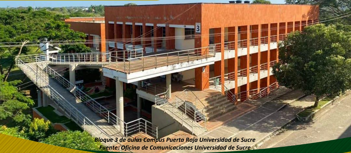
Bloque 3 de aulas Campus Puerta Roja Universidad de Sucre