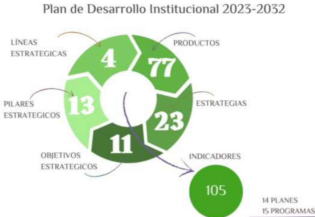
Figura 2. Contenido del Plan de Desarrollo Institucional.

La Universidad de Sucre, desde su origen en agosto de 1978, inició la formación y cualificación del talento humano sucreño con 250 estudiantes en los programas de Licenciatura en Matemáticas, Tecnología en Enfermería, Ingeniería Agrícola y Tecnología en Producción Agropecuaria en una infraestructura de terceros y un promedio de 43 egresados anuales durante su primera década. Hoy, con una infraestructura propia de más de 36 hectáreas distribuidas en 3 campus y más de 6 mil estudiantes, anualmente se entregan al mercado laboral alrededor de 900 egresados con formación de pregrado y posgrado en 30 programas académicos que cubre la oferta de formación en tecnologías, profesionales, especializaciones, maestrías y doctorados.